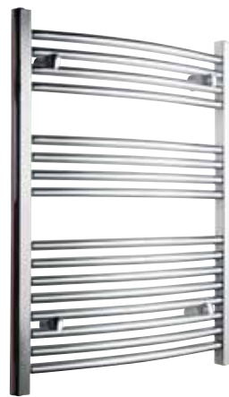
Svängd modell, rund design, förkromad

500 x 800 mm (b x h) Effekt: 246 W Art nr 876 00 13