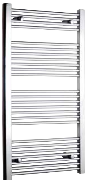
Rak modell, rund design, förkromad

500 x 800 mm (b x h) Effekt: 358 W Art nr 876 00 17