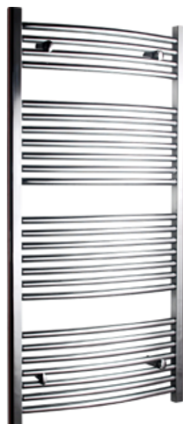
Svängd modell, rund design, förkromad

600 x 1 200 mm (b x h) Effekt: 445 W Art nr 876 00 14