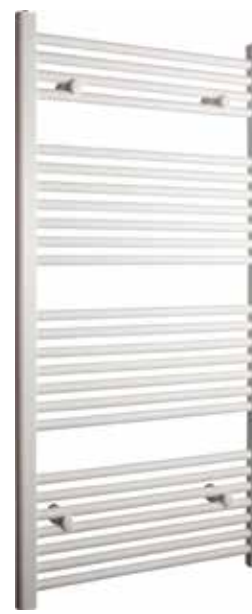
Rak modell, rund design, vit

600 x 1 200 mm (b x h) Effekt: 445 W Art nr 876 00 16