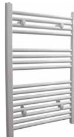
Rak modell, rund design, vit

500 x 800 mm (b x h) Effekt: 246 W Art nr 876 00 15