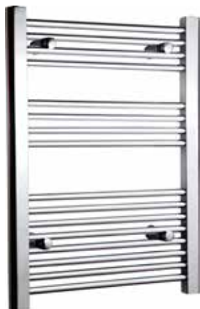
Rak modell, rund design, förkromad

Alterna Caldo Handdukstork i stål. För elpatron och/eller värmesystem. Levereras med fyra stycken flyttbara väggfästen med 22 mm justerbarhet i djupled, två stycken proppar samt en luftningsventil.