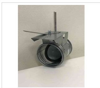
art.nr: 380140 Spjäll 315 Typ 4 m. motorhylla