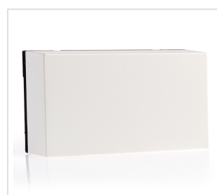
art.nr: 399174 Tempgivare EvoControl & AVC-02 rum