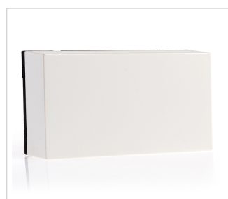
art.nr: 399188 Fuktsensor rum programmerad