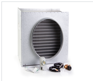
art.nr: 399098 VB-sats A250S/A400S EC Värme