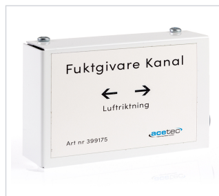
art.nr: 399175 Fuktsensor EvoControl kanal