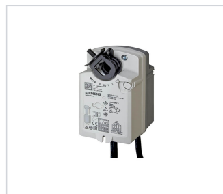
art.nr: 340098 Spjällmotor Fjäder 230V GPC321.1A