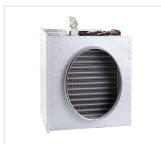
art.nr: 399124 VB-sats A250S/A400S EC Kyla