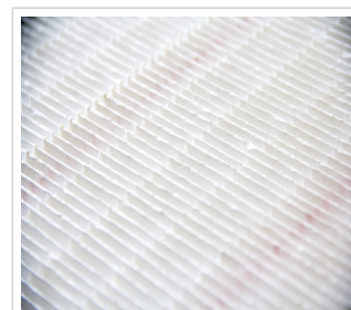
art.nr: 380002 Filter A250/A400/A230/A390 ePM1 55%