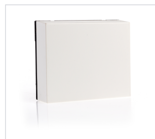
art.nr: 340124 Fuktsensor EvoControl rum