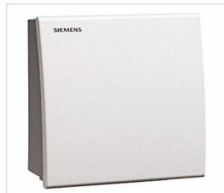
art.nr: 340099 Luftkvalitegivare CO2 Rum QPA 2000