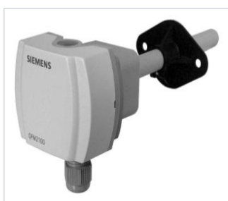
art.nr: 340113 Luftkvalitegivare CO2 Kanal QPM2100